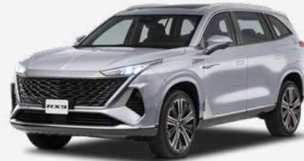
Distancia entre ejes 2915 mm