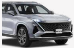
Ancho total 1,967 mm