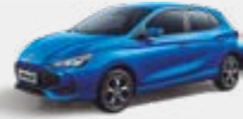
St. Moritz Blue